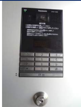
エントランスオート ロック