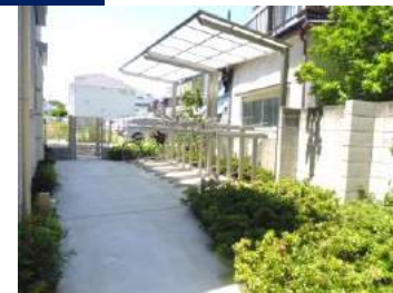
敷地内屋根付駐輪場