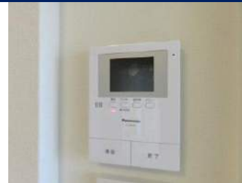
TVモニタ付インターホン